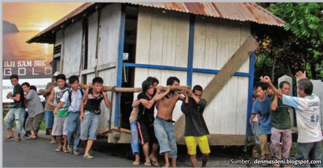
Gambar 6. Mapalus, cara masyarakat Minahasa bekerjasama

Para pahlawan dan tokoh Penghayat telah membuktikan tidak ada perjuangan tercapai tanpa belajar bersama. Kesuksesan dalam memperjuangkan pelayanan bidang pendidikan dan kemansiaan serta eksistensi Penghayat di Indonesia membutuhkan belajar bersama. Hidup adalah belajar. Belajar dilakukan sepanjang hayat.