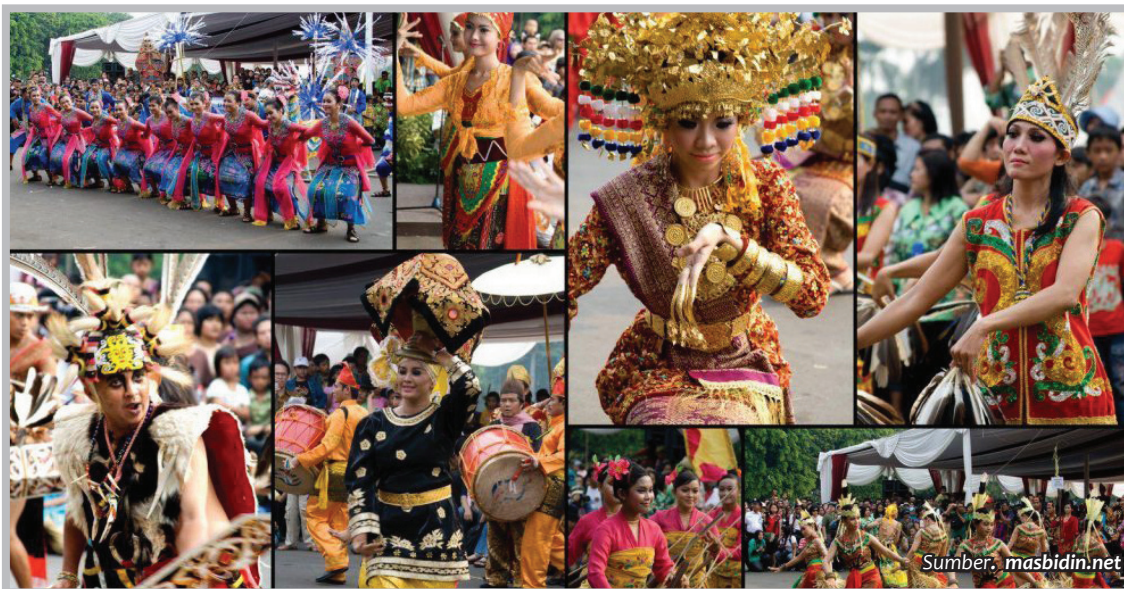
Gambar 10. Keragaman Budaya di Indonesia

Indonesia, karena letaknya yang berada dalam lalu lintas dunia mempertemukan kepercayaan terhadap Tuhan Yang Maha Esa dengan semua agama dan budaya dunia. Dengan sendirinya, Indonesia kondisinya beragama. Keragaman itu sebagai sebuah kenyataan yang wajib dikelola sebagai potensi pemersatu dalam pembangunan nasional. Potensi pemersatu itu dinyatakan dalam Bhinneka Tunggal Ika (Berbeda-beda tetapi tetap satu jua). Cara melindungi kebhinnekaan itu adalah mengaturnya dalam aturan bersama melalui UUD NRI 1945.